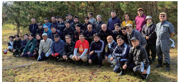
海岸林再生活動に取り組んだ参加者