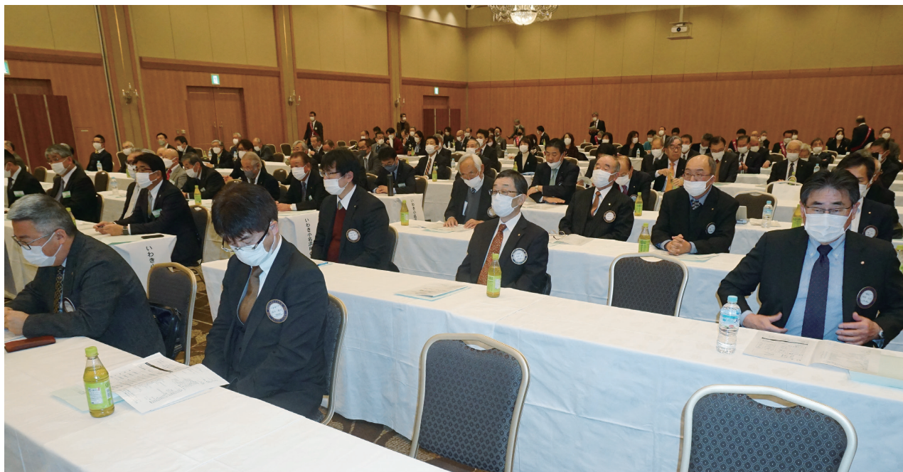
IM に参加したいわき平ロータリークラブの会員ら