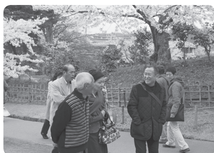
午後になってちょっと冷えてきた