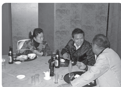
インタビューを受けた感想は？