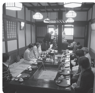
早くめっば飯来ないかな