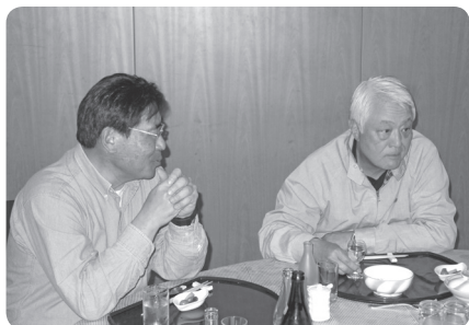
あとは帰るだけ お酒がすすみます