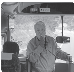
会津へ向かうバスの中で会長挨拶