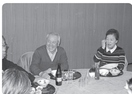
今日の余韻に浸るも花より団子？