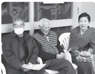
大河ドラマ館を見終わって一息