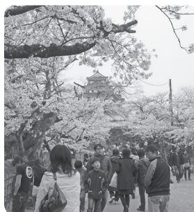
鶴ヶ城も満開の桜でいっぱい