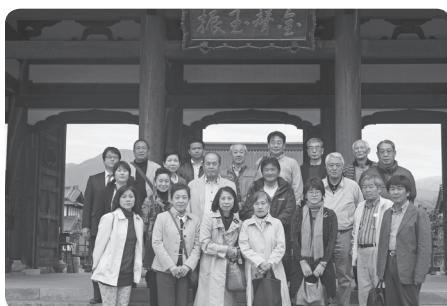
日新館の戦門の前で