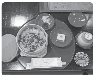
名物めっば飯（シラス入り）