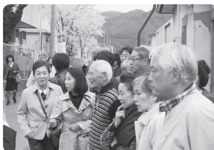
大河ドラマ館の前にて