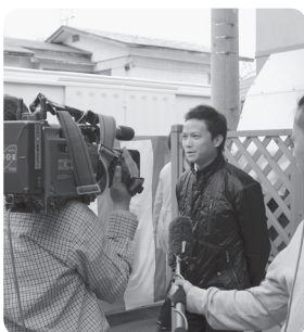
ドラマ館で取材を受ける ソータイくん