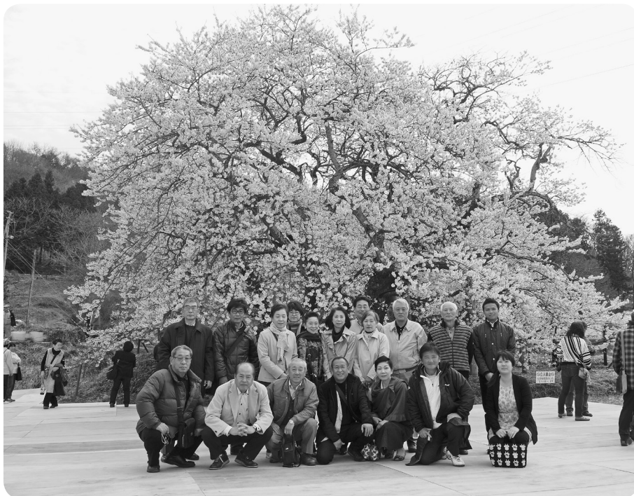
満開の石部桜をバックに

いわき市役所⇒石部桜⇒「田事」にて「めっぱ飯」⇒日新館⇒八重の桜大河ドラマ館 ⇒鶴ヶ城⇒郡山ビューホテルアネックスにて夕食⇒いわき市役所