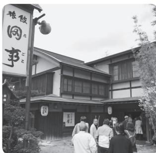
ここで名物めっば飯を